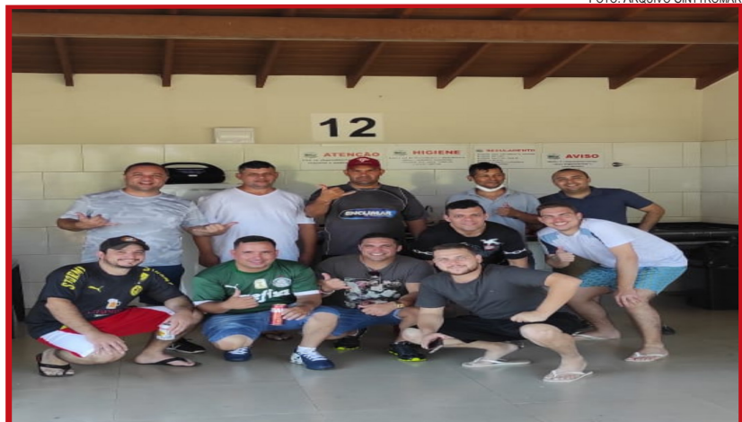
Acompanhando o torneio, familiares e amigos alugaram os quiosques para passar a tarde