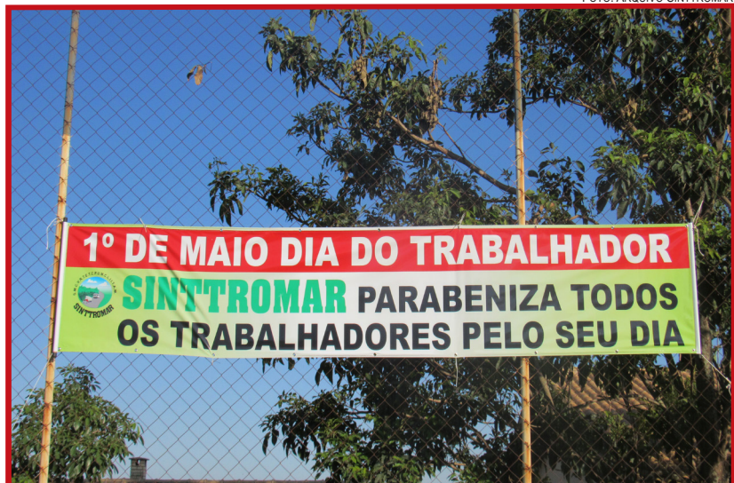
Recepção dos jogadores