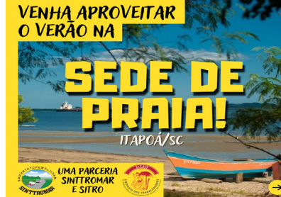
ARTE: GABRIEL RAMOS

Em negociações com o poder público e as empresas, sindicato tem brigado por direitos e melhorias à categoria. Página 3