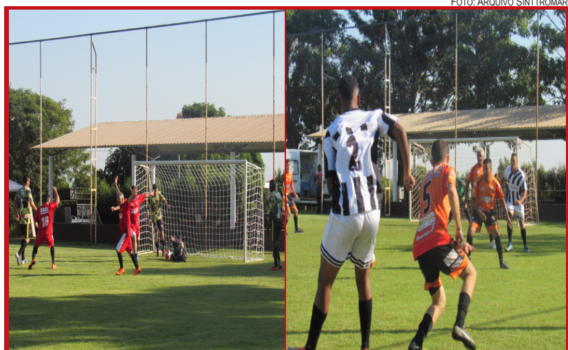
Equipes jogaram o bom futebol