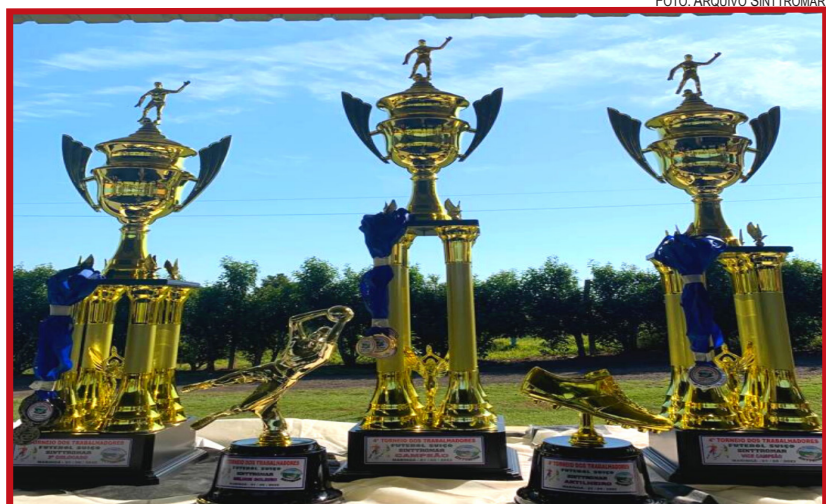
Prêmios foram entregues às equipes e jogadores